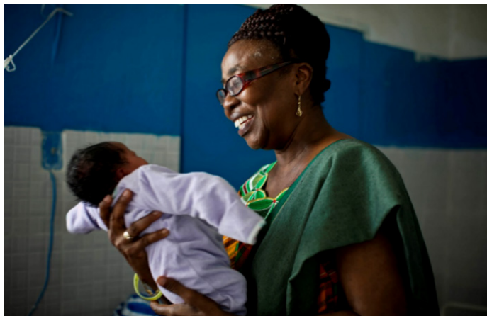
Libéria

MCSP espère que les directives opérationnelles des SMR aideront les intervenants nationaux, les gestionnaires du programme et les partenaires à faire avancer les efforts de mise en œuvre et l'apprentissage dans divers contextes. MCSP a travaillé avec les intervenants locaux au Nigéria et au Guatemala pour appliquer les premières phases des directives opérationnelles et contribue à la conception, à la mise en œuvre et au suivi d'interventions visant à améliorer les soins centrés sur la personne et à réduire les mauvais traitements dans le cadre du réseau multipays de l'OMS sur la qualité des soins pour améliorer la SMN ( www.qualityofcarenetwork.org ).